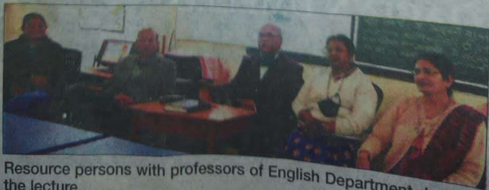
Resource persons with professors of English Department during the lecture.